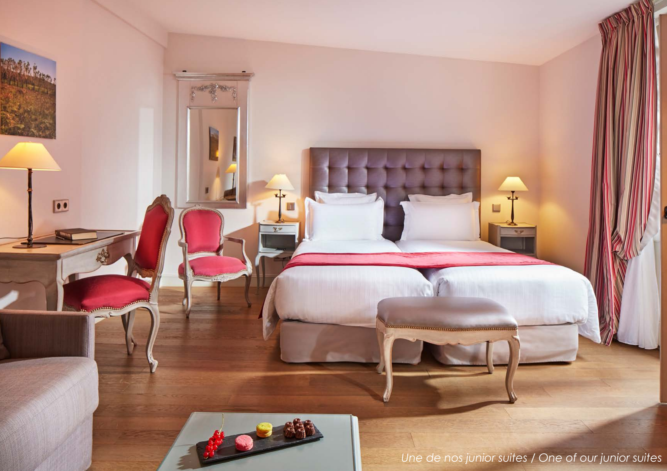
Une de nos junior suites / One of our junior suites